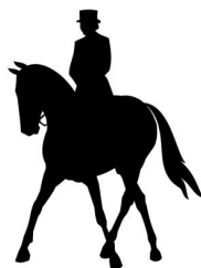
Схема езды для любителей. Начальный уровень.

*Настоящее Положение имеет юридическую силу при наличии согласования по обеспечению безопасности, охраны общественного порядка и антитеррористической защищенности администрации муниципального образования, места проведения соответствующего Мероприятия, включенного в календарь мероприятий.